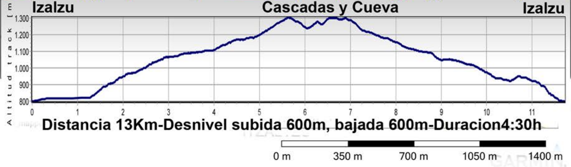
Cascadas de Moive-Cueva Gartxot desde Izalzu