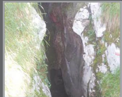
CUEVA DE SARASTARRI

Los rediles son lugares para cobijar los rebaños y protegerlos por la noche y suelen contar con cabañas, vivienda de los pastores cuando suben a los pastos de montaña en verano. Históricamente éste ha sido uno de los principales lugares de pastoreo en Ataun, por lo que veremos más de una majada a lo largo del camino.