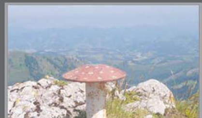
SARASTARRI ~ 989 M

Cueva que cobija un bello pozo en su interior (25 x 10 x 3 m). Según la leyenda una bella dama se aparece cada cierto tiempo en su entrada.