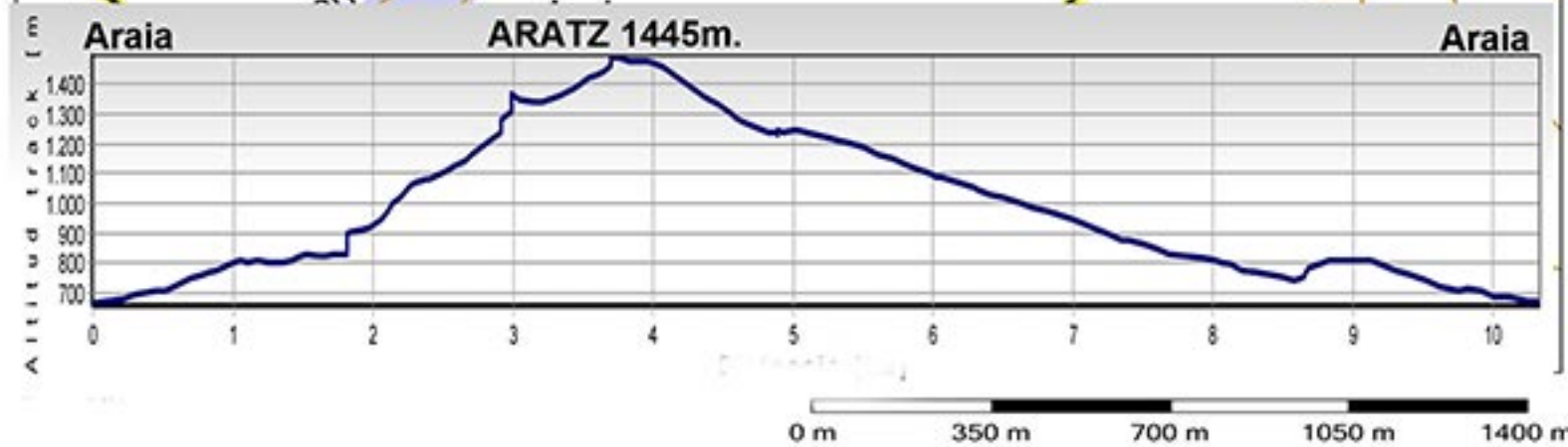
ARATZ 1445 m desde ARAIA