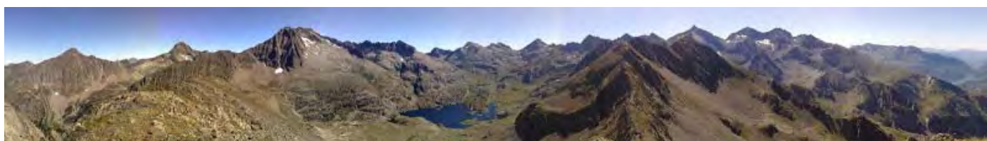
(Panorámica desde la cima : Petit Arriel, Arriel, Palas, Frondella, Balaitus, Cristal , Facha, Infiernos, Garmo Negro, Algas, Sabocos...)

Tras el empacho del paisaje (y el almuerzo) cuesta comenzar el descenso, pero en la cima he tomado la decisión de bajar por Respomuso -lo cual