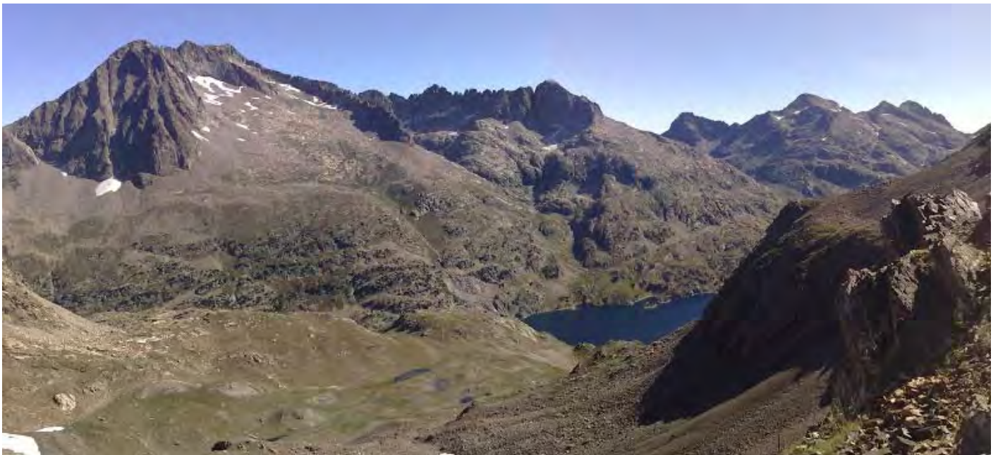
(Frondeillas, Balaitus, Cresta del diablo...)

Tras este aburrido tramo, salpicado de restos de sirgas y cementos llega la recompensa: