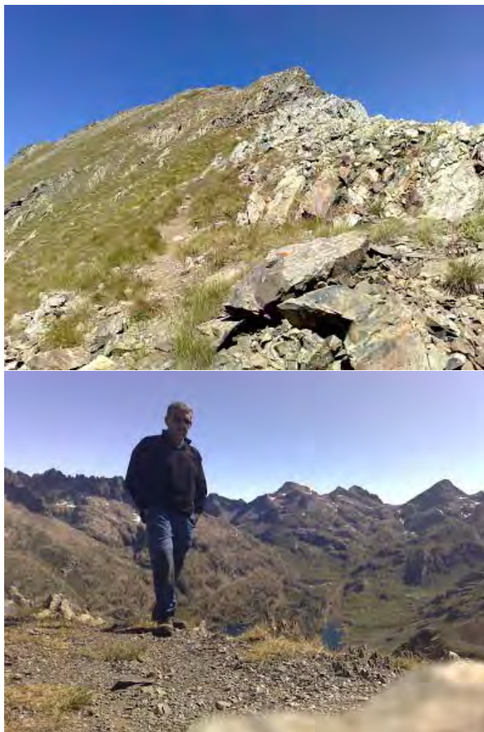
(Arista cimera ) (En la cima)

Solo quedan unos 15 minutillos de fácil arista (pese a lo que leí en algunas guías por lo menos en verano no presenta ninguna complicación) y llego a la cima: en total unas tres horas desde que he comenzado.