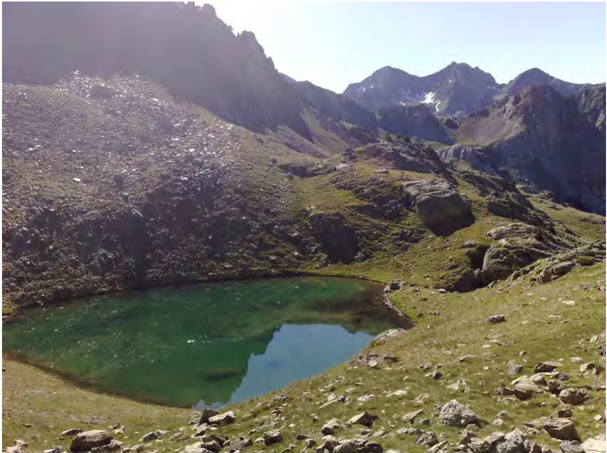
(Iboncecho. Al fondo el macizo de Garmo Negro y Algas)

Tras este aburrido tramo, salpicado de restos de sirgas y cementos llega la recompensa: