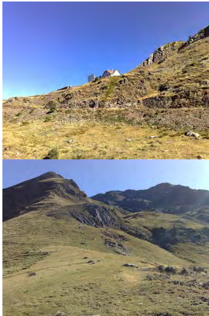
(Caseta y espejo repetidor ) (Comienzo del sendero de Iboncecho)

posteriormente al collado de Mallafre. (Como referencia: no se debe de llegar al nacimiento de la tubería de presión. En la explanada donde comienza el sendero de subida al ibón hay restos de un antiguo cartel indicador).