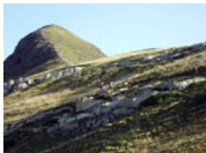
Ladeando el Arlas