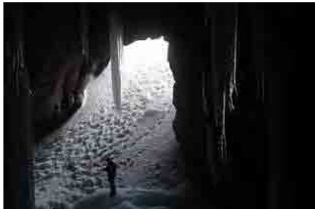
Gruta helada de los Lecherines